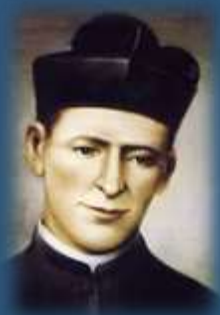
S. Agostino Roscelli Fondatore delle Suore dell'Immacolata