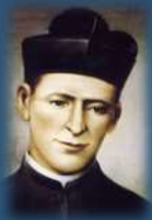
S. Agostino Roscelli Fondatore delle Suore dell'Immacolata